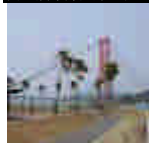
阿公店水庫風景區／三井