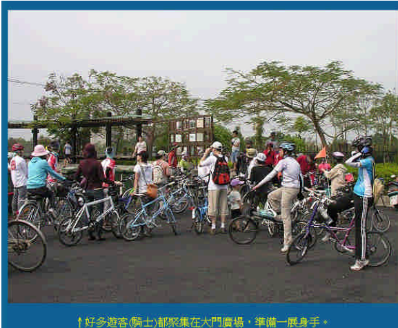
↑好多遊客(騎士)都聚集在大門廣場，準備一展身手。